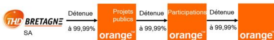
Schéma capitalistique actuel